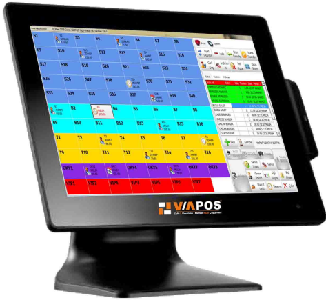
Dokunmatik Endüstriyel POS Terminal