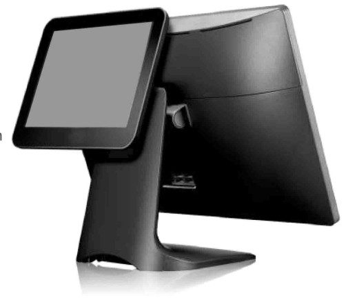
Müşteri Ekranlı Endüstriyel POS Terminal